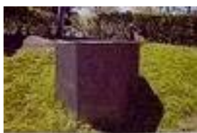
(La pieza instalada en el Pratt Institute de Brooklyn)

Dentro de toda la trayectoria de Serra a partir de los años setenta del pasado siglo, se pueden distinguir cuatro grandes grupos : las grandes planchas de acero rectangulares que se sitúan verticalmente en variadas disposiciones; los sólidos bloques de acero forjado, casi siempre cúbicos; las piezas relacionadas con elementos arquitectónicos , como pilares (a la que pertenece 'Finkl Octagon') y dinteles; y, más recientemente, las gigantescas planchas curvas y elípticas que conocemos bien gracias a las instalaciones y exposiciones recientes en Euskadi.