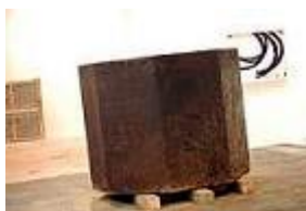
(Galería Carreras Múgica, ARCO 2007)